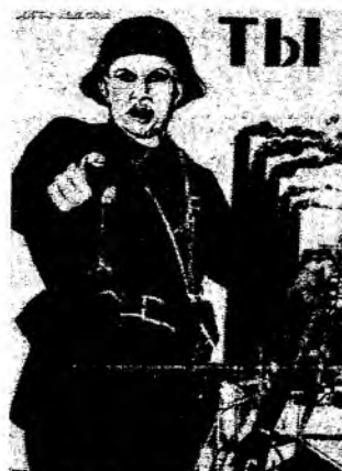
4) ТЫ ЧЕЛ ПОМОГ ФРОНТУ?

Помощь победить в ВОВ - 2, 3, 4, 6 55 1, 5 - планка, но священного революции