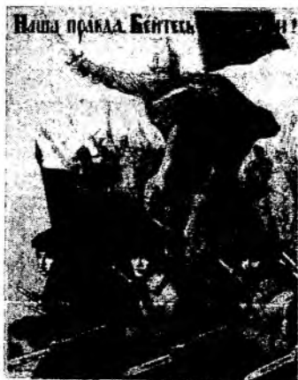
3) ПУСТЬ ВДОХНОВЛЯЕТ ВАС В ЭТОЙ ВОЙНЕ МУЖЕСТВЕННЫЙ ОБРАЗ НАШИХ ВЕЛИКИХ ПРЕДКОВ!