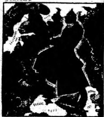
1) БУДЬ НА СТРАЖЕ!