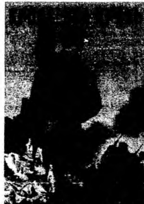
2) СМЕРТЬ ЗА СМЕРТЬ